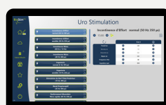
PROGRAMMI DI INCENTIVAZIONE