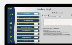
PROGRAMMA DI BIOFEEDBACK