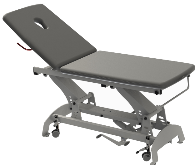
Letto idraulico a due sezioni con pedale