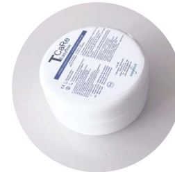
crema conduttiva da 100 ml