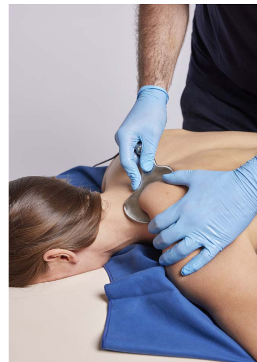
Terapia Manuale Assistita con uno dei ferri del kit e piastra di ritorno.