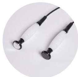
elettrodi resistivo e capacitivo Ø 25 mm