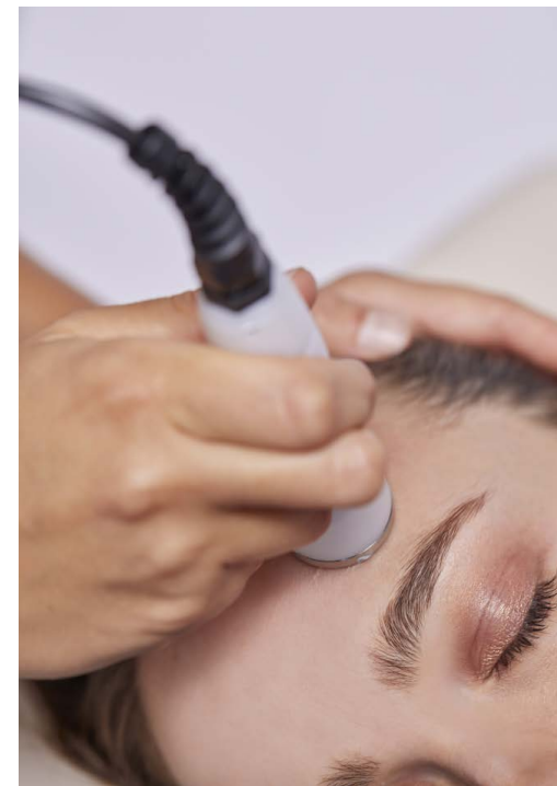
Trattamento dermatofunzionale con elettrodo bipolare resistivo.