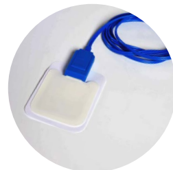
elettrodo resistivo funzionale