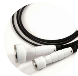
manipoli bipolari dermatofunzionali