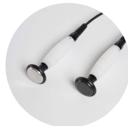
elettrodi resistivo e capacitivo Ø 35 mm