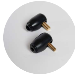
raccordo a gomito