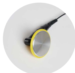
elettrodo di ritorno dinamico