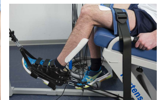
Trattamenti con elettrodo resistivo funzionale e piastra di ritorno adesiva.