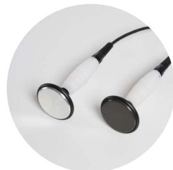
elettrodi resistivo e capacitivo Ø 55 mm