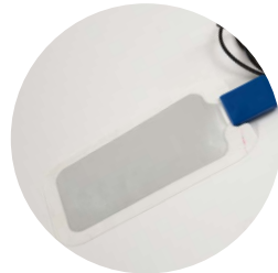
piastra di ritorno adesive