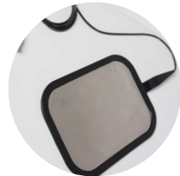
piastradi ritorno flessibile in acciaio