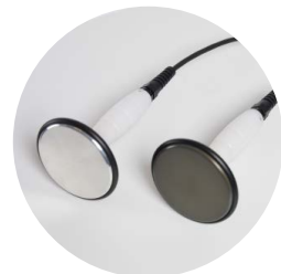
elettrodi resistivo e capacitivo Ø 75 mm