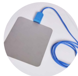
piastra di ritorno rigida in acciaio