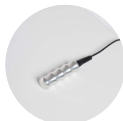
elettrodo di ritorno cilindrico