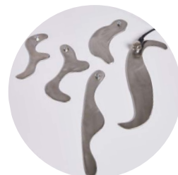
Kit ferri per TMA