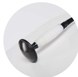
elettrodo capacitivo convesso